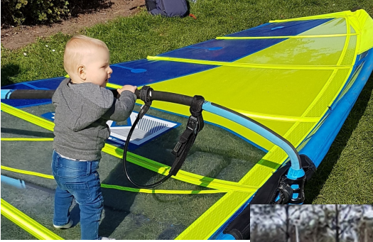
Leon Pastoor (bijna 1 jaar)