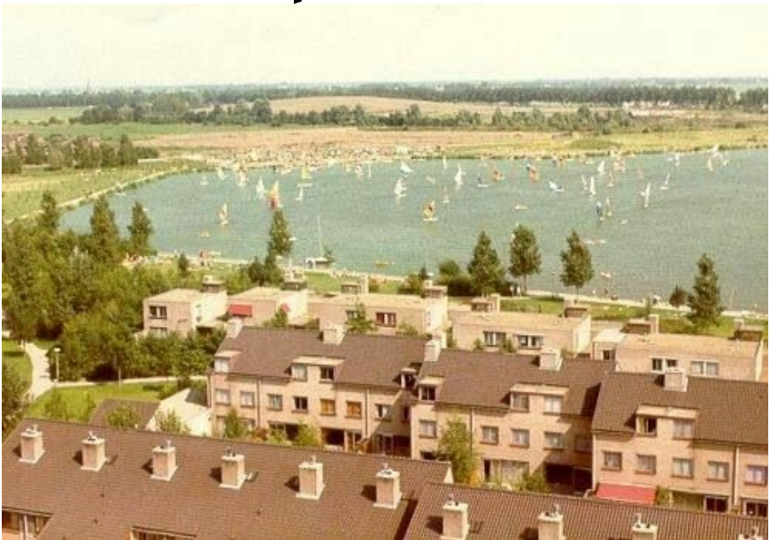
Foto door Dieter genomen vanaf de Saffierflat, ca 1977 Toen bestonden China Palace en Park Zegersloot nog niet Er waren wel héél, héél veel surfers